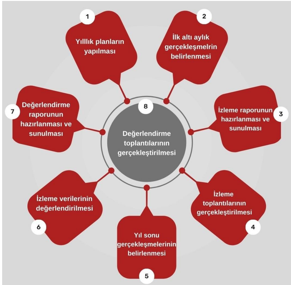
Şekil 4: İzleme ve Değerlendirme Süreci

İzleme ve değerlendirme sürecinin işleyişi ana hatları ile Şekil 4'te özetlenmiştir. Denizli-Çivril Ali Kameroğlu Anaokulu Müdürlüğü 2024–2028 Stratejik Planı'nda yer alan performans göstergelerinin gerçekleşme durumlarının tespiti yılda iki kez yapılacaktır. Ara izleme olarak nitelendirilebilecek yılın ilk altı aylık dönemini kapsayan birinci izleme kapsamında, MEM Stratejik Plan İzleme ve Değerlendirme Modülü vasıtasıyla, harcama birimlerinden sorumlu oldukları performans göstergeleri ve stratejiler ile ilgili gerçekleşme durumlarına ilişkin veriler toplanarak konsolide edilecektir. Performans hedeflerinin gerçekleşme durumları hakkında hazırlanan "Stratejik Plan İzleme Raporu" Müdür ve kurum içi paydaşların görüşüne sunulacaktır. Bu aşamada amaç, varsa öncelikle yıllık hedefler olmak üzere, hedeflere ulaşılmasının önündeki engelleri ve riskleri belirlemek ve yıllık hedeflere ulaşılmasını sağlamak üzere gerekli görülebilecek tedbirlerin alınmasıdır. Yılın tamamına ilişkin ikinci izleme kapsamında ise MEM Stratejik Plan İzleme ve Değerlendirme Modülü vasıtasıyla, tarafından harcama birimlerinden sorumlu oldukları performans göstergeleri ve stratejiler ile ilgili yıl sonu gerçekleşme durumlarına ait veriler toplanarak konsolide edilecektir.